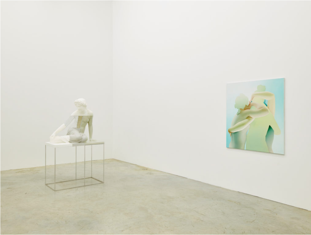
Insane in the Membrane , Installation view, Collection Philara, Düsseldorf, 2018; photography by Paul Schöpfer.

AMM：你最近在不同形状的表面上画了一些侧面的半身像。你能跟我们说说这个新方向吗？是从你以前的想法发展而来的，还是一个全新的尝试？你用的是什么材料？这些镂空代表什么？