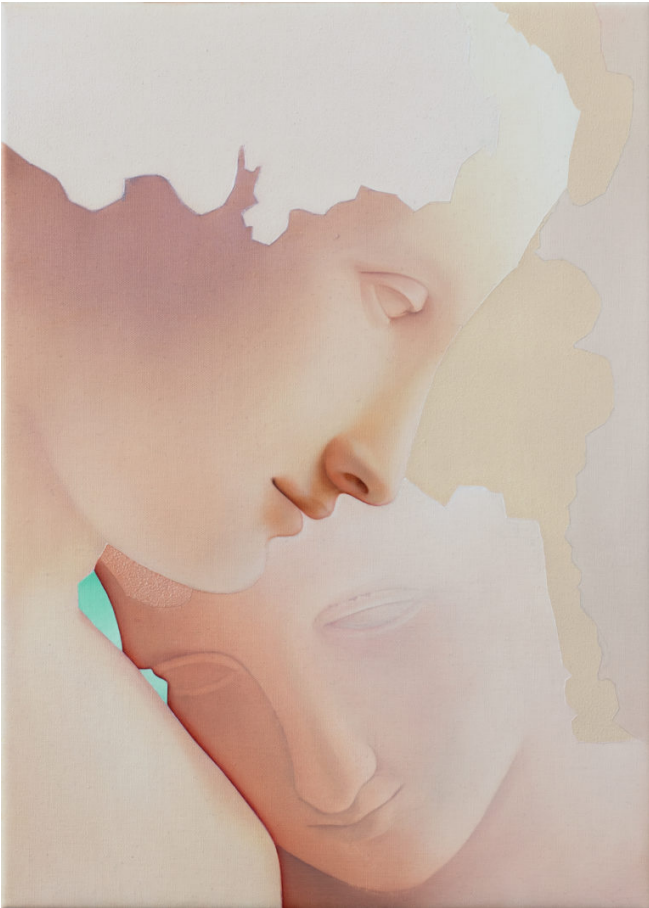
Vivian Greven, Tru , 2018, oil on canvas, 49 x 35 cm.

VG：哈！没错。我认为这样的企图和尝试从来都是扎根在人类最深的意识当中的。我们总是在一种缺失的状态中，所以常常需要去填补它。“完美的美”这个想法是与神圣观念相联系，而神圣又跟宇宙连接的；在宇宙中，生与死是一对恋人。我觉得我们似乎已经忘记了这些，遗忘使我们痛苦并忽视自己的某些部分。现在我们谈论的身体政治就是要解决这种非常严重的缺失感。